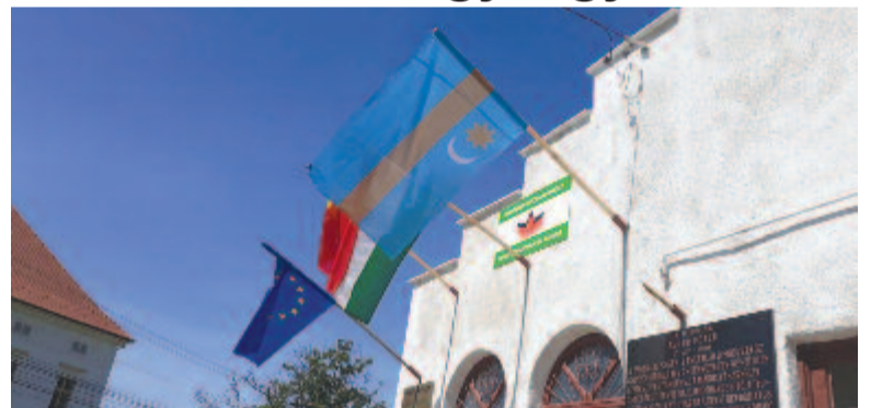
Nem szándékos rongálás áll a háttérben, és csak ideiglenesen hiányzik a zászló