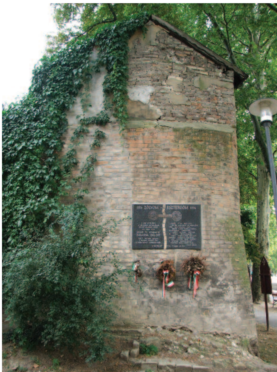
Vadszőlő borította – Balassi Bálint megsebesülésének helye az esztergomi Kis-Duna sétányon

E hely közelében a Víziváros ostrománál kapott halálos sebet 1594. május 19-én Kék-kői és Gyarmathy Balassa Bálint költő végvári katoná, a magyar nyelvű líra európai rangú megeremelője. E szöveg áll megsebesülésének helyén, egy várfalromon az esztergomi Kis-Duna sétányon.