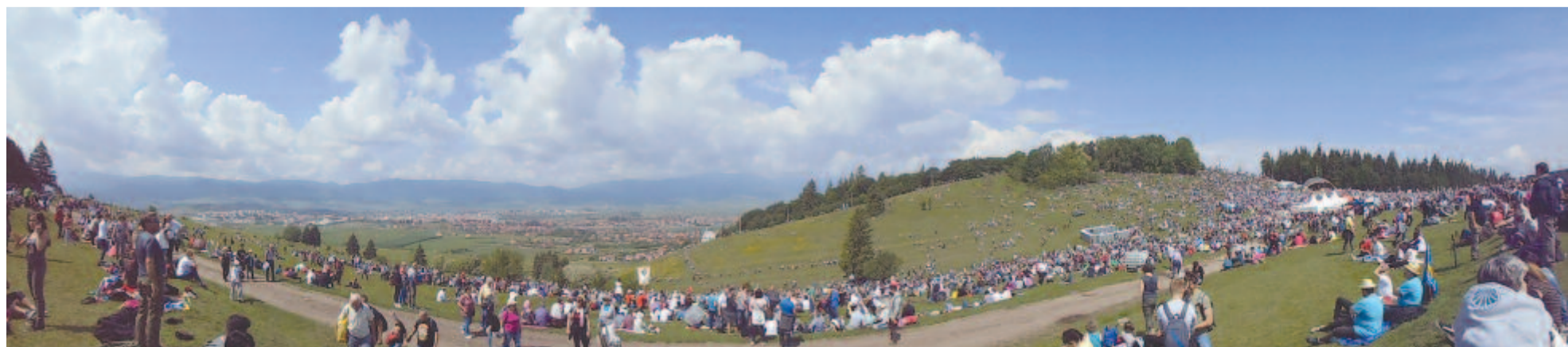
Gomolyfelhők Csíksomlyó felett 2018 pünkösdjén

Kelt 2018 utolsó hetében, a középiskolai ballagások idején